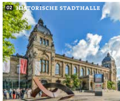
02 HISTORISCHE STADTHALLE