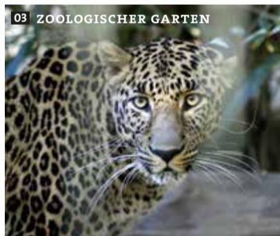
03 ZOOLOGISCHER GARTEN