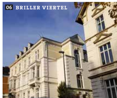
06 BRILLER VIERTEL